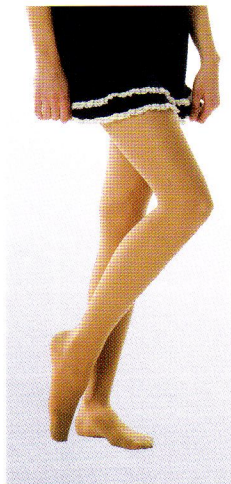
パンティストッキング